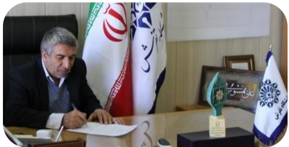
پرچمدار بیداری و نماد آگاهی، در صحنه تاریخ جاودان بمانند.

جریانی است که در آن دانشجویان ایستادگی و استکبار ستیزی را به جهانیان ثابت نمودند تا همیشه به عنوان