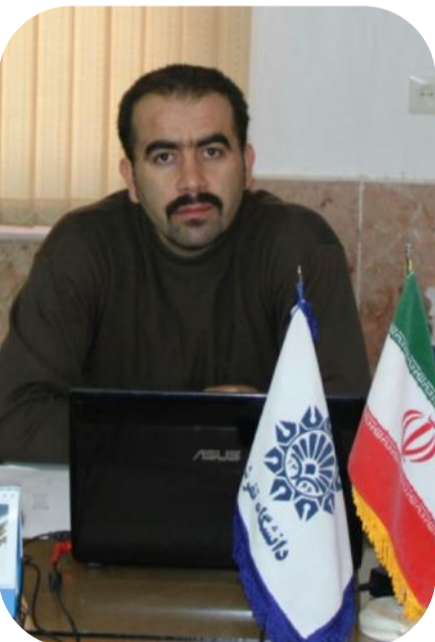
خوابگاه و آشپزخانه که با همت والایشان موجبات رفاه و آسایش دانشجویان را فراهم می نمایند کمال تقدیر و تشکر را دارم.