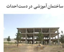
ساختمان آموزشی در دست احداث