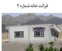
قرائت خانه شماره ۲