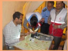
توسط تعدادی امدادگر از هلال احمر شهرستان تست فند خون و فشار از دانشجویان بعمل آمد.

معاونت دانشجویی و فرهنگی دانشگاه روز سه شنبه مورخ ۲۹ اردیبهشت ۹۴ از ساعت ۱۹ تا ۲۲ در خوابگاه دختران و پسران اقدام به برگزاری ایستگاه سلامت و ایستگاه صلواتی نمود. در این مراسم مسئولین دانشجویی و فرهنگی نیز حضور داشتند و با استقبال با شکوهی از سوی دانشجویان روبرو گردید. با بخش شیرینی و شربت از دانشجویان پذیرایی شد.