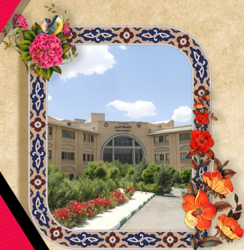
خوش آن دمی که بهاران قرارمان باشد ظهور مهدی (عج) زهرابهارمان باشد...