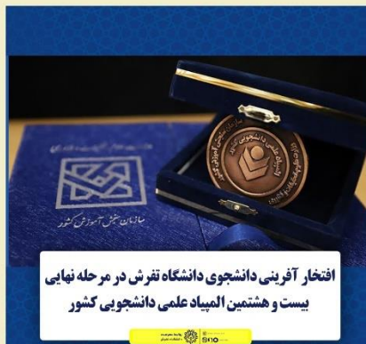
افتخار آفرینی دانشجوی دانشگاه تفرش در مرحله نهایی بیست و هشتمین المپیاد علمی دانشجویی کشور

معاونت آموزشی و تحصیلات تکمیلی دانشگاه، ضمن تبریک کسب این موفقیت به خانواده دانشگاه تفرش و دانشجویان عزیز، برای این دانشجوی افتخار آفرین و تمام دانشجویان این دانشگاه آرزوی سلامتی و موفقیت می نماید