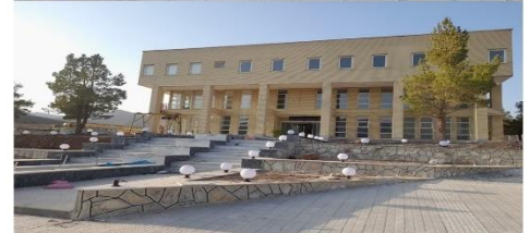
• تکمیل و بهسازی ساختمان اداری یعقوبی نسب