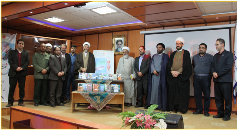
آیین رونمایی از مجموعه ۴۰ جلدی «ره نامه» امروز در دانشگاه تفرش همزمان با دانشگاه های سراسر کشور برگزار شد.

همزمان با سراسر کشور؛ مجموعه ۴۰ جلدی «ره نامه» در دانشگاه تفرش رونمایی شد