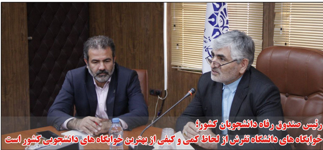
رئیس صندوق رفاه دانشجویان کشور؛ خوابگاه های دانشگاه تفرش از لحاظ کمی و کیفی از بهترین خوابگاه های دانشجویی کشور است