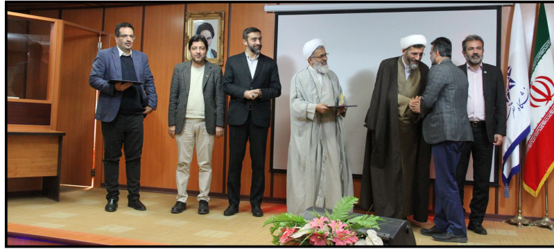
با حضور مدیر کل حوزه وزارتی و روابط عمومی وزارت علوم؛ پژوهشگران برتر دانشگاه تفرش تجلیل شدند