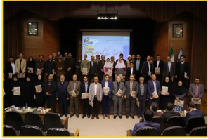
کسب عنوان پژوهشگر برتر استان مرکزی توسط دانشجوی دانشگاه تفرش

در آیین تجلیل از پژوهشگران و فناوران برگزیده استان مرکزی در سال ۱۴۰۲ از دانشجوی کارشناسی ارشد دانشگاه تفرش تجلیل شد.